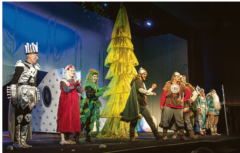
В финале торжествует добро.

– Когда актеры шутят, веселятся внутри себя, безобразно различают в хорошем смысле